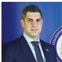
ティムラズ レジャバ氏 在日ジョージア大使館 特命全権大使