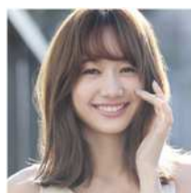
高田 秋氏 ファッションモデル タレント 唎酒師 ワインソムリエ